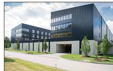
Ansicht des Neubaus von Norden.

Die beiden dreigeschossigen Wohnriegel entstanden als moderne und zukunftsweisende Holzkonstruktion in Brettsperrholzbauweise aus heimischem Nadelholz. Alle Wände und Decken wurden als vorgefertigte Elemente auf