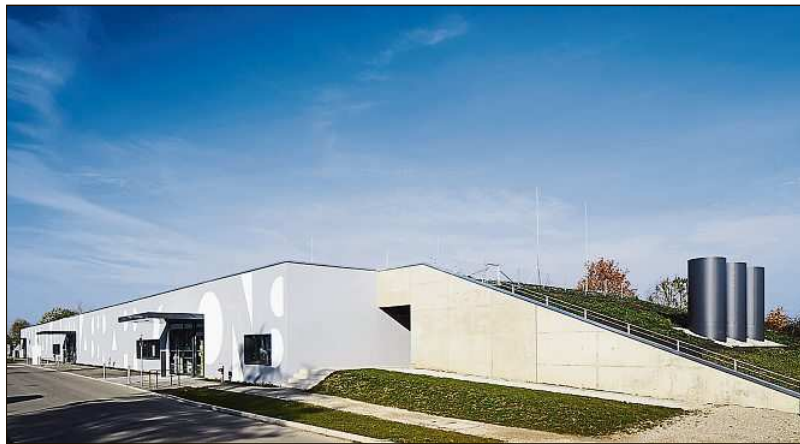
Der CALA-Neubau von Südosten her gesehen.

Wenn irgendwo in Europa Menschen vor Strahlung geschützt werden sollen, ist der Pressather Bauunternehmer Otto Pravida meist mit dabei – der Oberpfälzer ist der Herr der Strahlenschutzbunker. Die patentierte „Forster-Sandwich-Construction“ ermöglicht die Abschirmung hochenergetischer Teilchen, kostenoptimiert und nachhaltig.