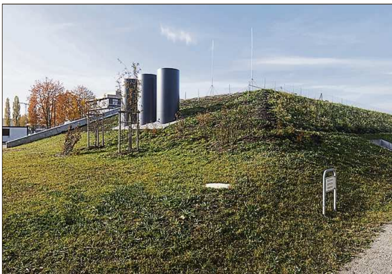
Der Neubau am Rand des Landschaftsschutzgebiets.

Mit CALA entstand unter der Projektleitung des Staatlichen Bauamts München 2 am Standort Garching ein weiterer Neubau für die interdisziplinäre Spitzenforschung der Münchener Universitäten und ihrer Kooperationspartner, der allen beteiligten Wissenschaftlern ideale Forschungsbedingungen bietet. > CHRISTIAN LÄM