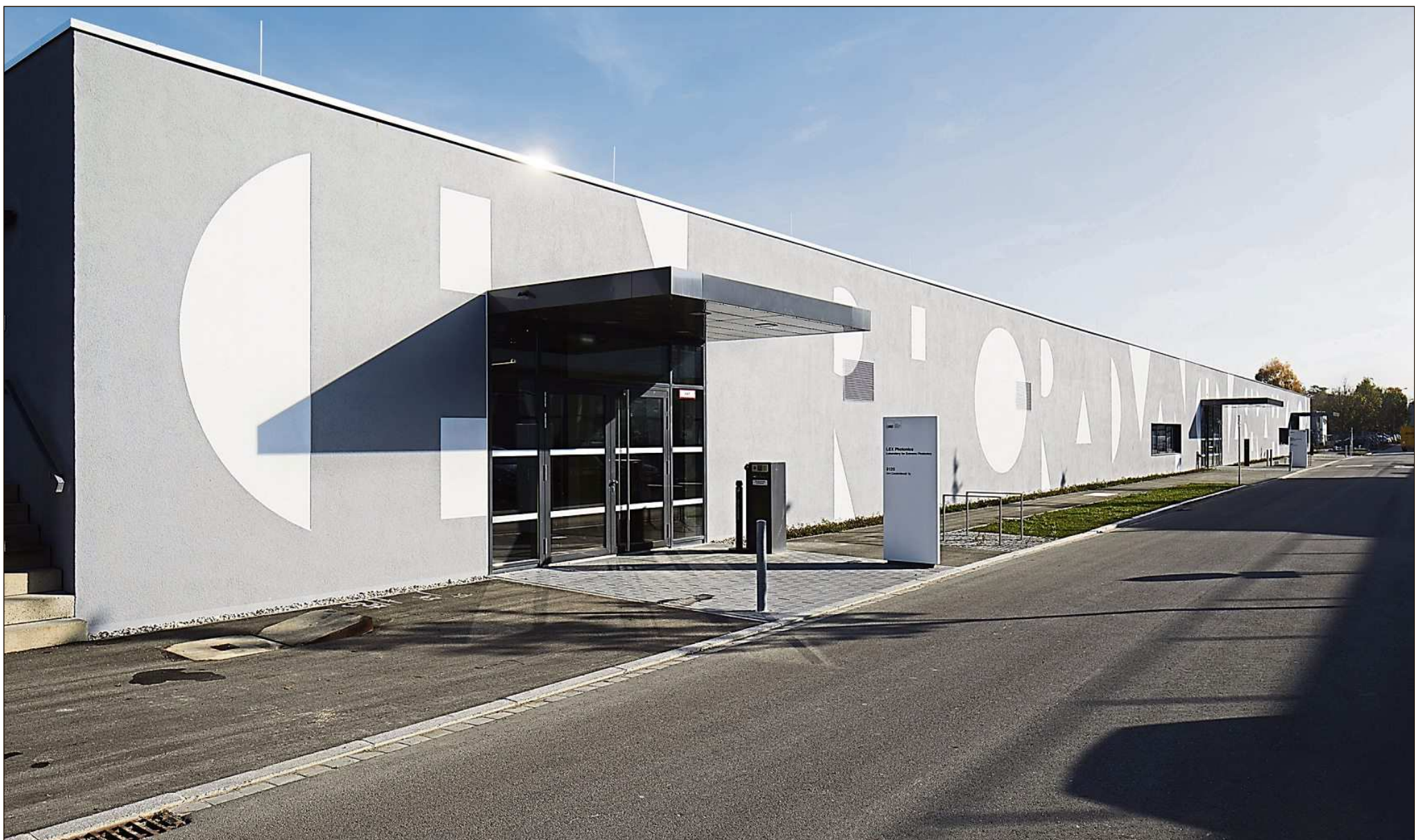
Die Südfassade des CALA-Neubaus.

Auf dem Hochschul- und Forschungscampus Garching konnte das Staatliche Bauamt München 2 im Herbst 2016 das neue Laserforschungszentrum „Centre for Advanced Laser Applications“ (CALA) an seine künftigen Nutzer übergeben. Im Rahmen des Exzellenzclusters „Munich Center for Advanced Photonics“ (MAP) betreiben die Ludwig-Maximilians-Universität (LMU) und die Technische Universität München (TUM) den neuen Forschungsbau als Gemeinschaftsprojekt. Physiker, Mediziner und Biologen werden hier weltweit einzigartige Lasertechnologien entwickeln und die Möglichkeiten für deren Anwendung in der Medizin ausloten. Aufgrund seiner überregionalen Bedeutung wird das Forschungsbauvorhaben